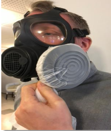
Täta filtret med påsen för att få tätt

Vid användning av filter med större inloppshål, där handflatan inte kan täcka hela hålet, t.ex. partikelfilter PRO 2000, krävs annan övertäckning för att medge täthet. T.ex kan en avfallspåse användas för ändamålet, se bilder nedan.