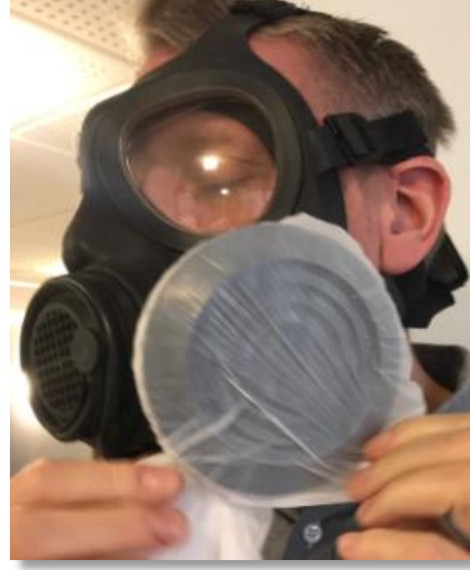
Ta bort påsen genom att dra bort den från filtret